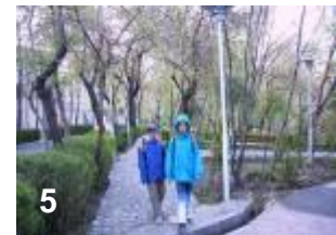
5) Pour le dernier bout nous marchons dans ce petit parc tranquille, avant de traverser la route Shariati qui est toujours très, très fréquentée.

Depuis que nous allons à pied à l'école les agressions des enfants ont beaucoup diminuées. Ils peuvent se défouillés déjà sur le chemin.