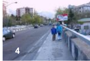
4) Pour la plupart du temps il y a beaucoup de circulation et pauteur. Nous sommes très content que nous puissions descendre toute de suite après le pont.