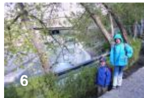
6) Sur cette photo vous voyez pourquoi il faut traverser le pont de l'autoroute (au fond), elle nous amène sur l'autre côté de la rivière.

Auparavant quand il fallait rentrer à l'hôtel en voiture, ils étaient parfois insupportables. Souvent nous descendions de la voiture déjà 1-2 km avant l'hôtel et nous marchions à pied le dernier bout.