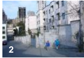
2) à gauche du photo c'est l'autoroute que nous passons. Sur la carte vous ne voyez pas cette route, car elle n'est pas indiquée. Pour cela c'est très rare qu'il y a une voiture qui nous croise.