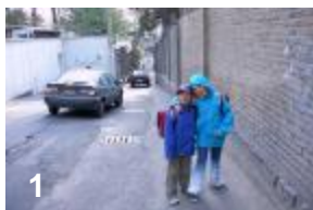
1) Ici, nous descendons la rue Lesani. Au fond vous voyez un passage étroit. Là, il faut toujours être très attentif, car les voitures ne font pas attention piétons, il faut que nous nous collons carrément au mur.

Au croquis j'ai souligné en rouge les rues dans notre adresse et le chemin pour aller à l'école (en vert). Les numéros en bleu note les photos.